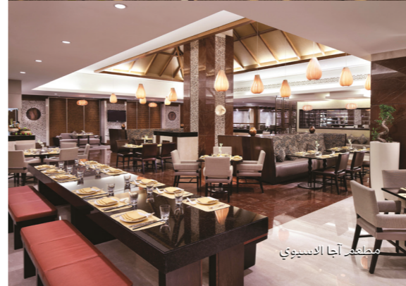
مطعم آجا الاسيوي