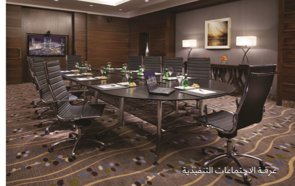
غرفة الاجتماعات التنفيذية