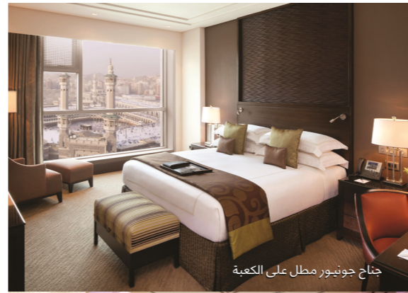
جناح جونيور مطل على الكعبة

تعتبر زيارة مكة المكرمة حلم العمر لملايين المسلمين لكونها قلب العالم الإسلامي وقبلة للحج والعمرة. كما تعطي إحساس متجدد بالسلام والسمو الروحاني يأتي مع مناسك كل عمرة. يعد فندق ساعة مكة فيرمونت بمثابة منارة لجميع زوار المدينة المباركة، إن فندق فيرمونت واحد من أكثر المباني إرتفاعاً في العالم، ويوفر إطلاقات بانورامية لا مثيل لها للبلد الأمين ويتميز بالموقع الأقرب إلى الحرم المكي الشريف، وبإعتباركم من ضيوفنا المميزين، سوف تستمتعون بإقامة مليئة بالتفاصيل، وسائل راحة رائعة ومأكولات متنوعة، كل ذلك يأتيكم بباقة من تقاليد الضيافة العربية الثرية التي لا مثيل لها.