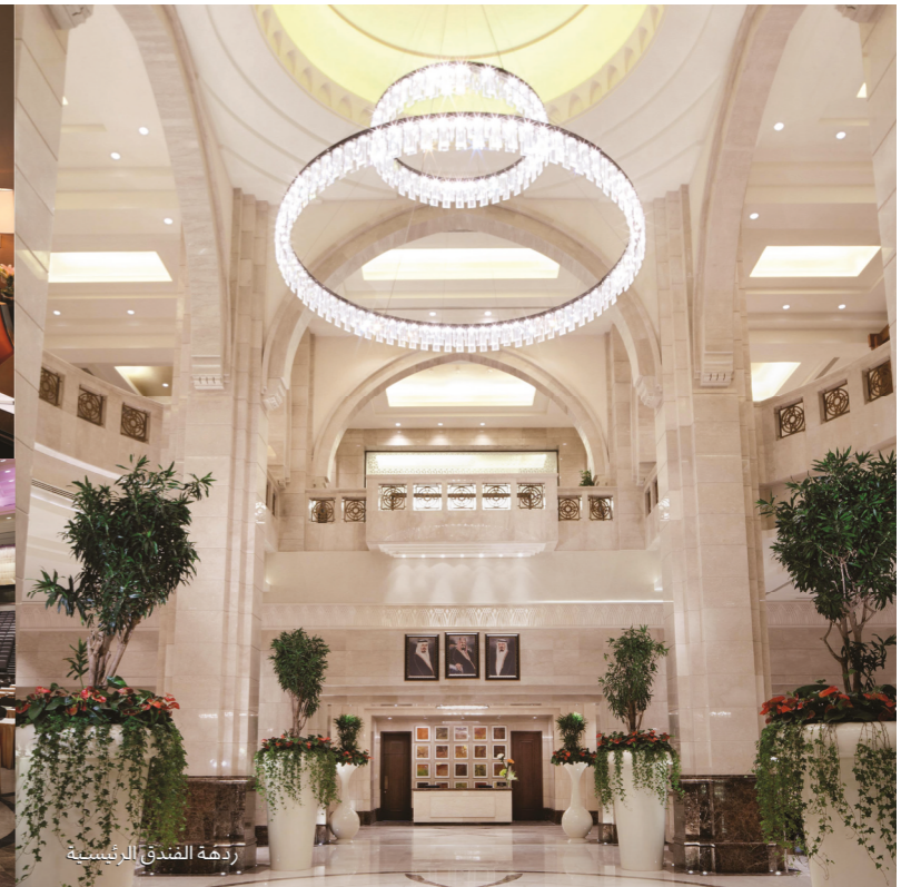
ردهة الفندق الرئيسية