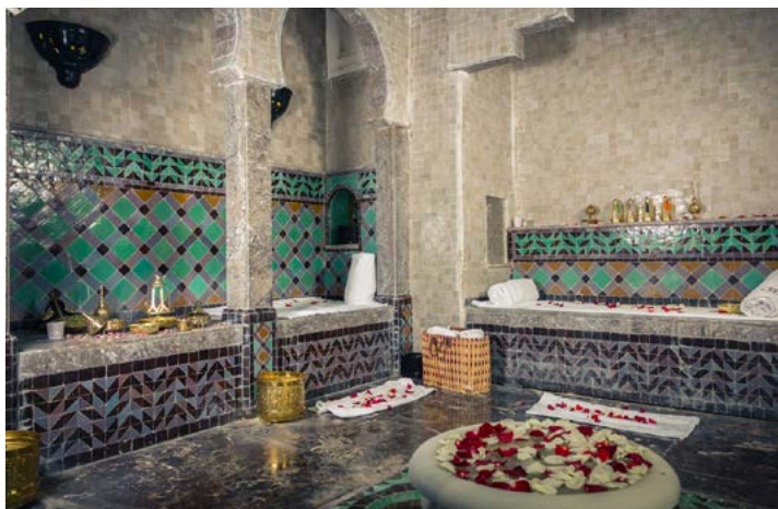
So SPA Rabat